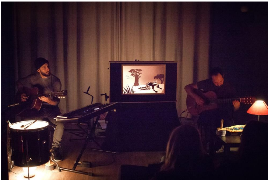
Photo du plateau

Tél : 02 99 87 21 62 /// Mail : lhallaliprod@gmail.com