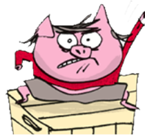
Léon le Che des verrats