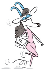
Cibelle la gazelle

Ces rendez vous seront aussi musicaux puisque les musiciens accompagneront les enfants avec leurs instruments (ukulele, percussions, clarinette...).